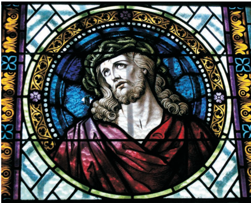
Tabl. III: Sulechówko, kościół św. Andrzeja Boboli, Ferdinand Müller, Quedlinburg. A – fragment witrażu „Gołębica Ducha Świętego” (zakrystia, okno południowe po lewej od strony wejścia, początek XX wieku), B – fragment witrażu „Chrystus w koronie cierniowej” (zakrystia, okno południowe po prawej od strony wejścia, początek XX wieku) (zbiory: Zachodniopomorski Konserwator Zabytków w Szczecinie, Delegatura w Koszalinie)