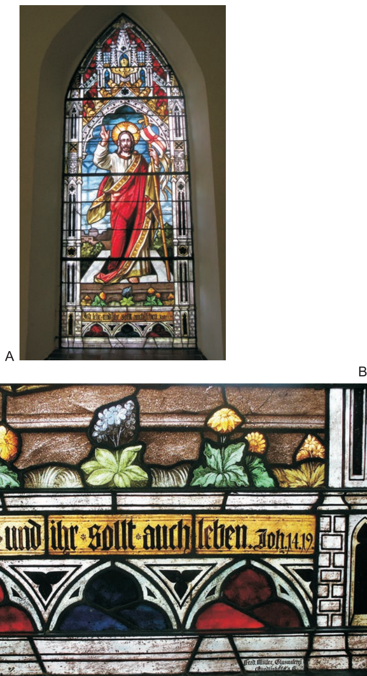
Tabl. I: Sulechówko, kościół św. Andrzeja Boboli, prezbiterium, okno północne, Ferdinand Müller, Quedlinburg, 1907 rok. A - witraż „Chrystus Zmartwychwstały”, B - fragment witrażu „Chrystus Zmartwychwstały” (zbiory: Zachodniopomorski Konserwator Zabytków w Szczecinie, Delegatura w Koszalinie)